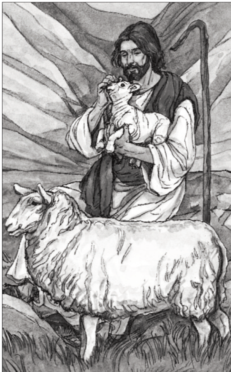
Jesús es nuestro Buen Pastor.