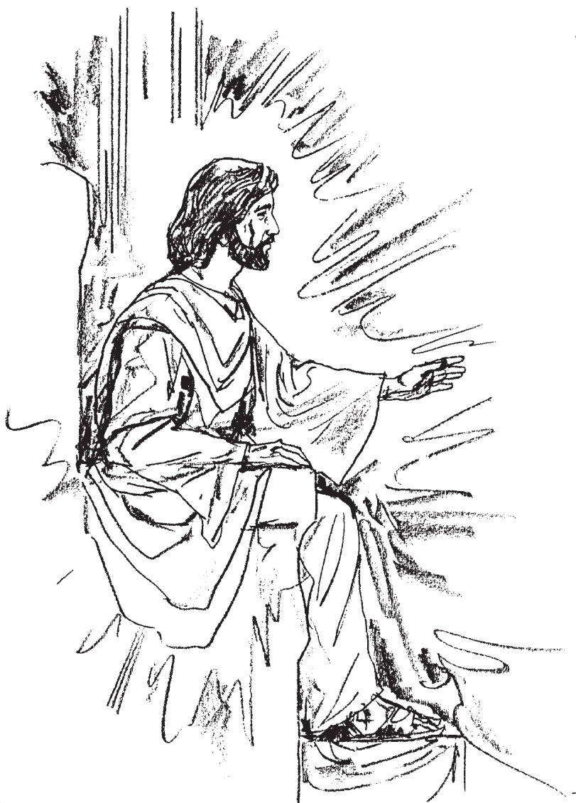
Cristo en su trono de juicio.