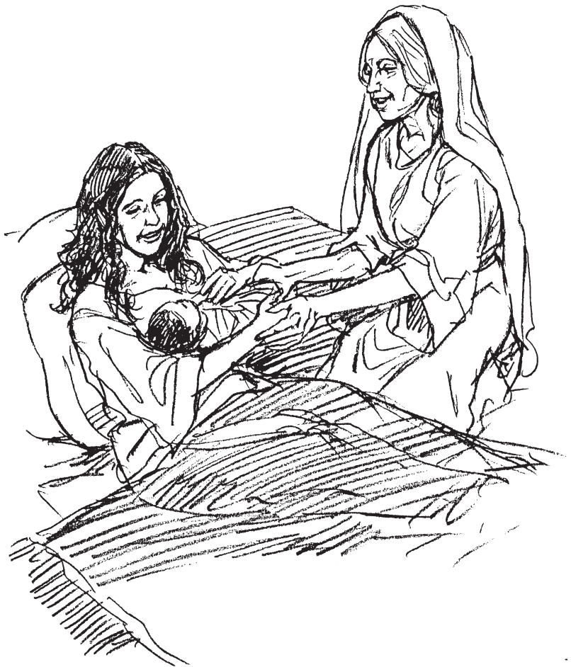
Madre, hijo, y partera israelitas.