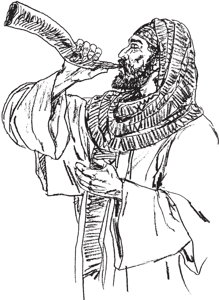
Músico del templo.