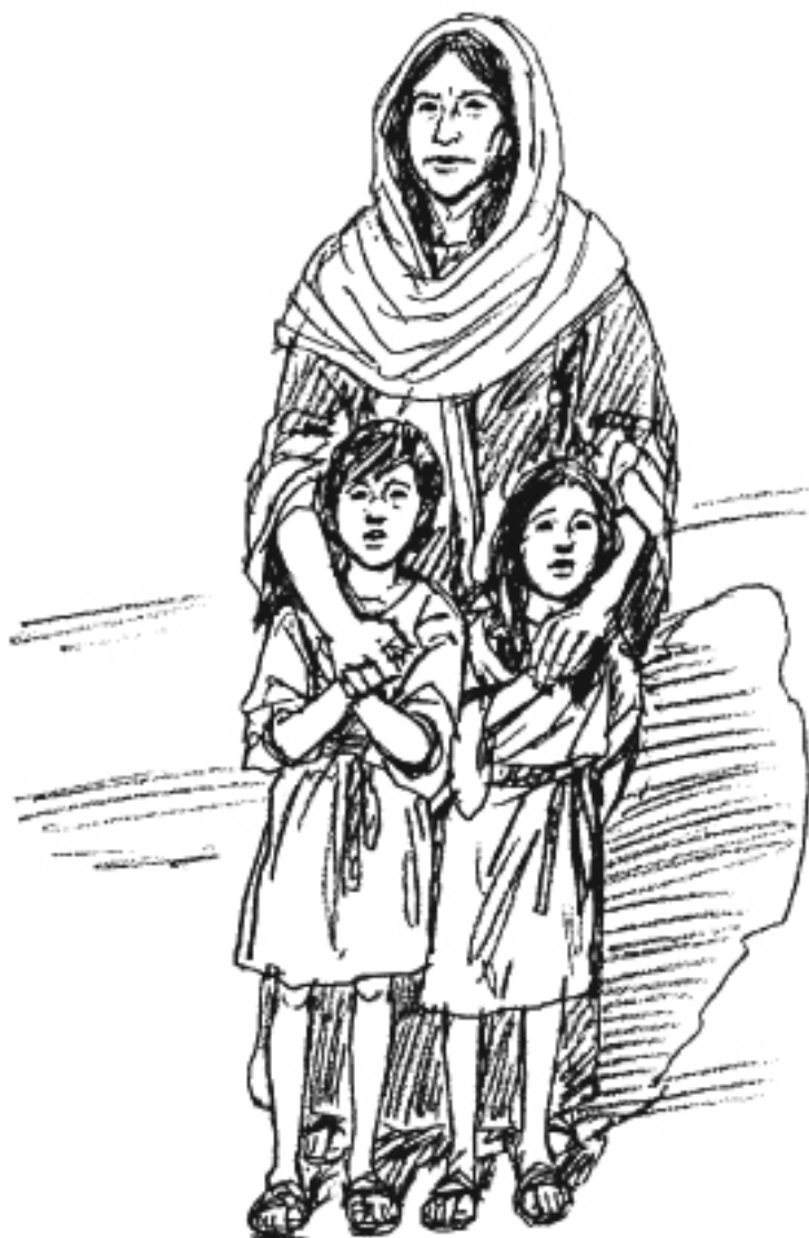
Una viuda y sus hijos.