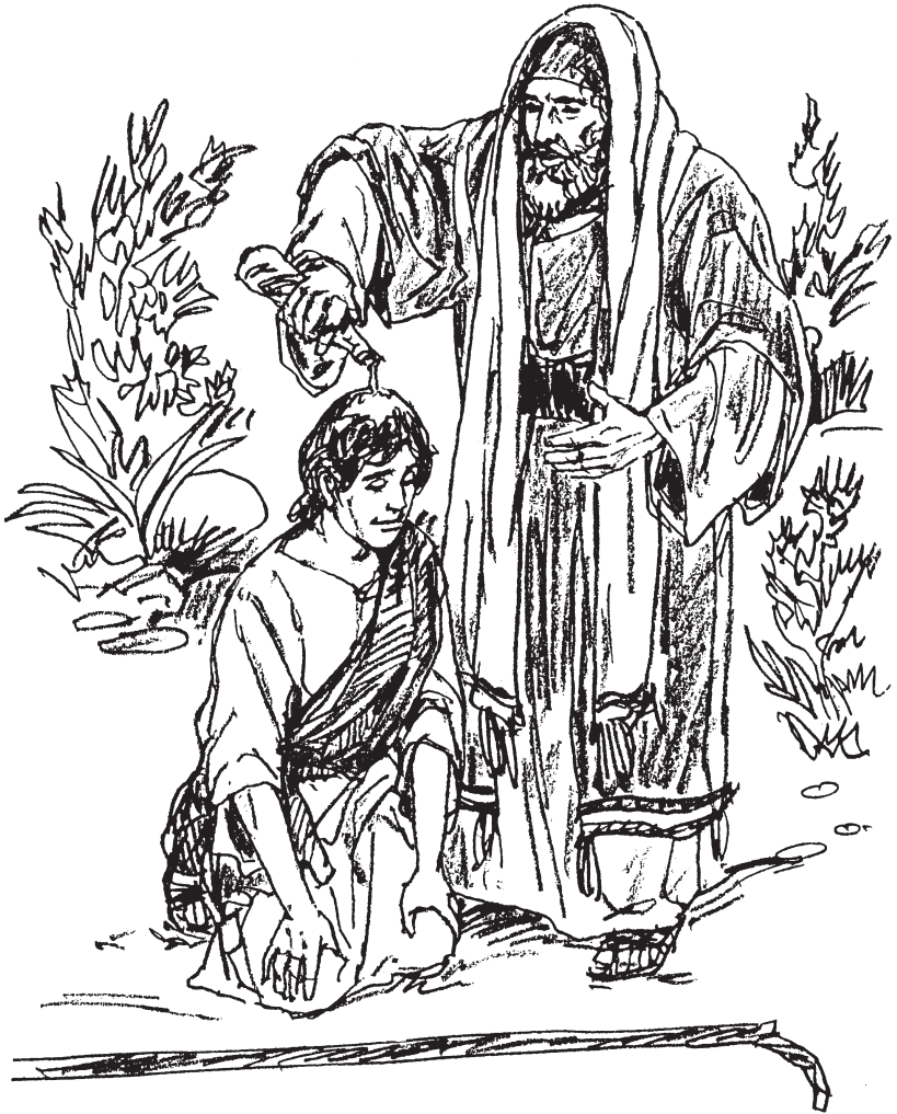
Samuel ungiendo a David.