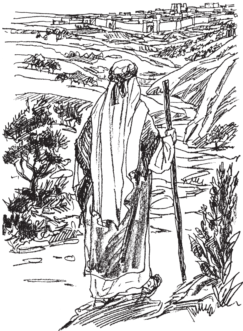
Peregrino israelita yendo a Jerusalén.