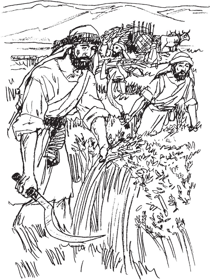
Israelitas cosechando trigo.